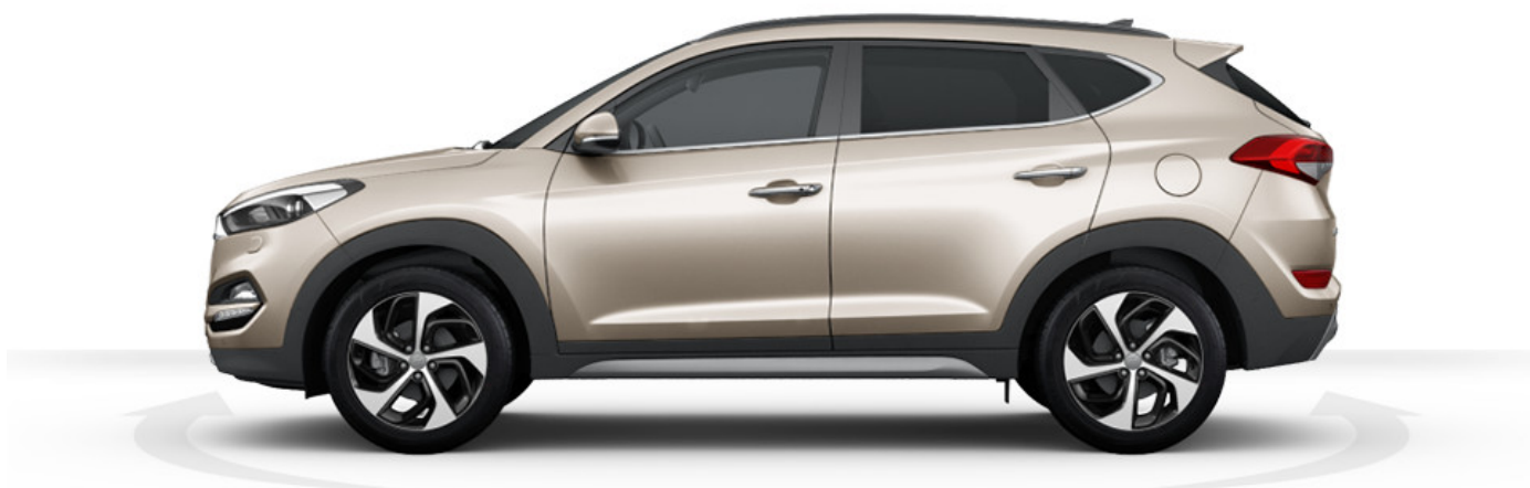
Abbildung ist als unverbindlich zu betrachten und stellt eine annähernde Beschreibung dar. Fahrzeugabbildungen enthalten z. T. aufpreispflichtige Sonderausstattungen.