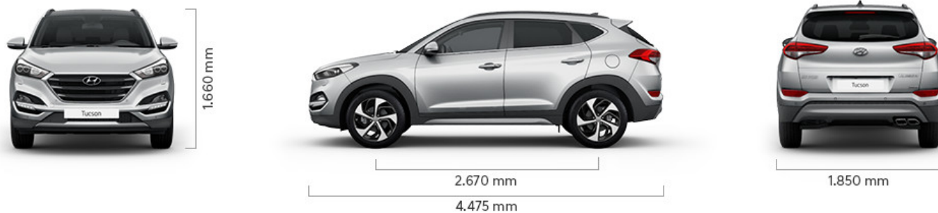
Abbildung ist als unverbindlich zu betrachten und stellt eine annähernde Beschreibung dar.

Fahrzeugabbildungen enthalten z. T. aufpreispflichtige Sonderausstattungen.