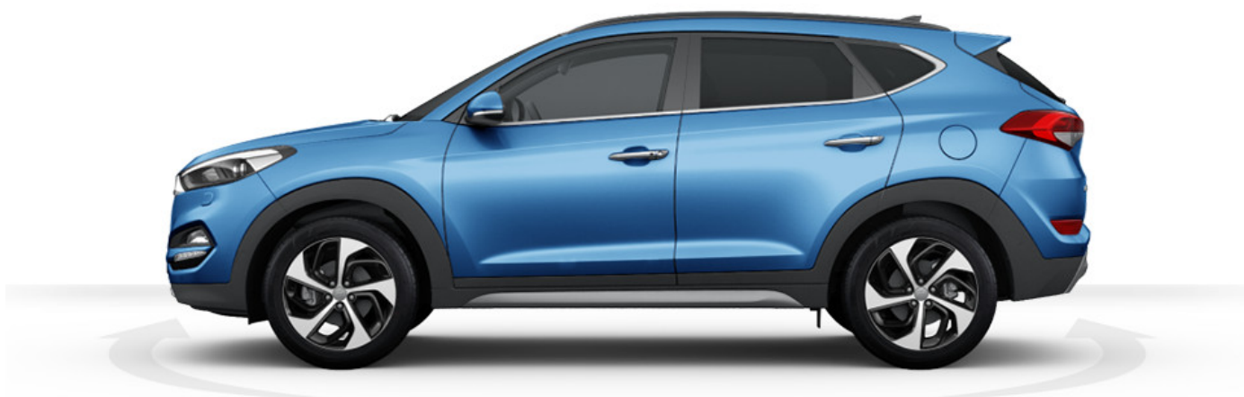
Abbildung ist als unverbindlich zu betrachten und stellt eine annähernde Beschreibung dar. Fahrzeugabbildungen enthalten z. T. aufpreispflichtige Sonderausstattungen.